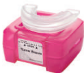
LM-Trainer™ Braces LM 94100TB