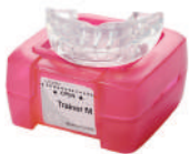
LM-Trainer™ средний LM 94100T

LM-Trainer™ можно использовать в молочном прикусе, например, до начала лечения с LM-Activator™. Его также можно использовать при функциональном обучении и для коррекции вредных привычек, например, реверсивного глотания или ротового дыхания, когда вредные привычки могут вызвать развитие неправильного прикуса.