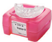
LM-Trainer™ маленький LM 94100S