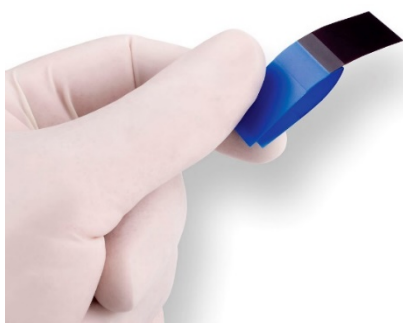
TrollFoil Mini Blue