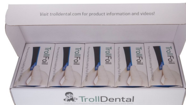
TrollFoil Blue 5*100 шт